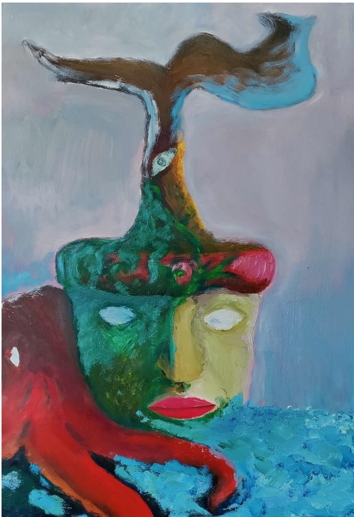
Martynas Buika. Metamorfozė . Drobė, aliejus, 70 x 50 cm, 2022 m.

Greičiausiai iš pavadinimo galėtumėte suprasti, kokią mintį bandau perteikti savo keverzonėje, kurią jūs galbūt netgi galėtumėte pavadinti „menišku kūrinium“. Kitų, dažnai mūsų mintims priešingų, žmonių įtaka mums, mūsų aplinkai, gyvenimui bei mintims ir pasauliniam požiūriui, arba, kitaip pasakius, mūsų pačių kaip individualių žmonių metamorfozė. Mus, kaip žmones, kūrinyje atstovauja vazonas su žmogaus veidu, o mūsų mintis – medelis, augantis vazone. Iš jūros gelmių išsiropojęs aštuonkojis yra tie anksčiau minėti įtakingieji, kurie bando mumis manipuliuoti bei keisti mūsų mintyse giliai įsišaknijusius požiūrius. Po truputį mes pradėdami pūti ir prarasti savo integralumą. Prarandame savo individualiąją būklę ir galų gale aštuonkojis, pilnai apčiuopęs mus, nusitraukia į šaltosios jūros gelmes. Mes „skęstame“.